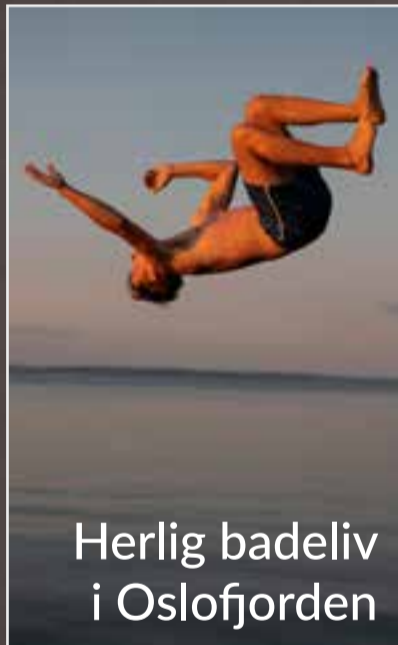
Herlig badeliv i Oslofjorden