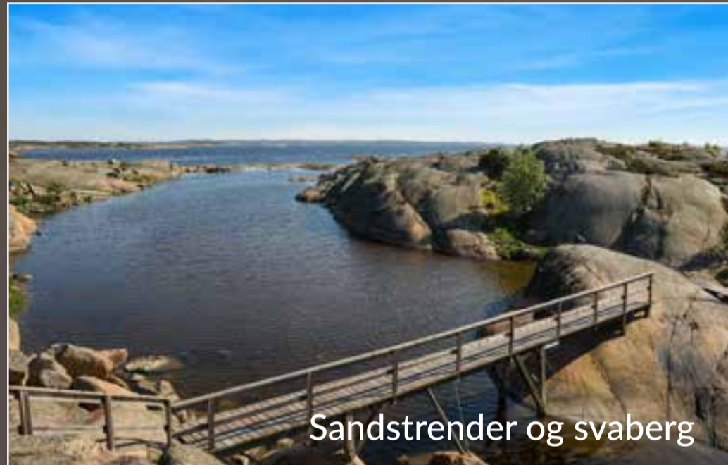
Sandstrender og svaberg