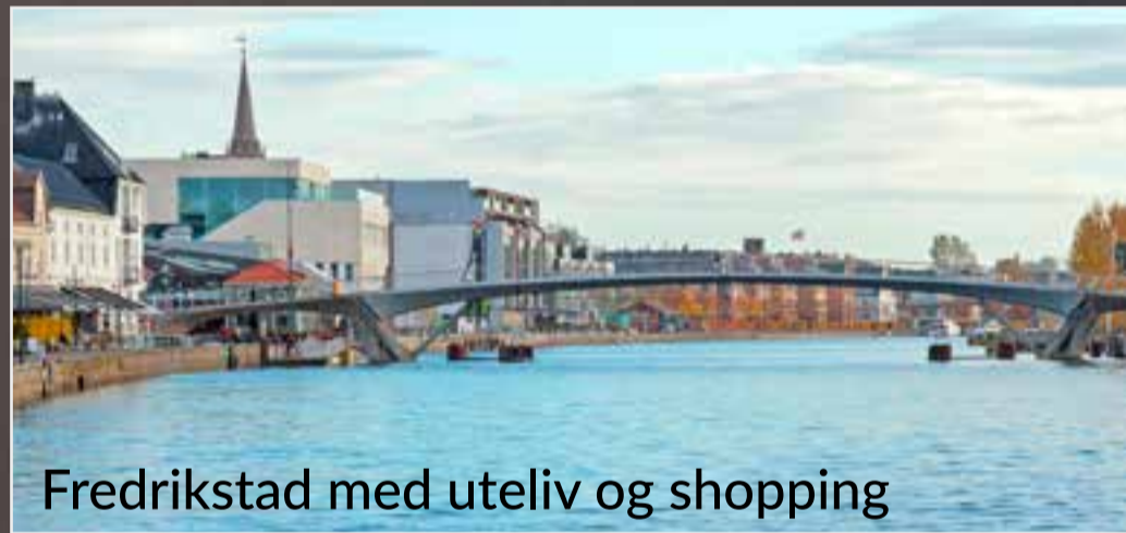
Fredrikstad med uteliv og shopping